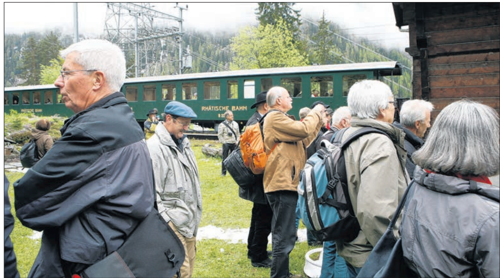
Nostalgie pur beim Bahnhof Stuls als der historische Sonderzug Halt macht.

bereits zum festen Inventar des Bahnmuseums. Darüber hinaus präsentieren die Veranstalter ein attraktives und kulturell vielfältiges Sommerprogramm, das nicht nur Bahnfans interessieren wird, sondern auch Familien mit Kindern – bei gutem wie bei schlechtem Wetter – gut unterhält. Weitere Informationen zu den Veranstaltungen etc. finden sich unter www.bahnmuseum-albula.ch .