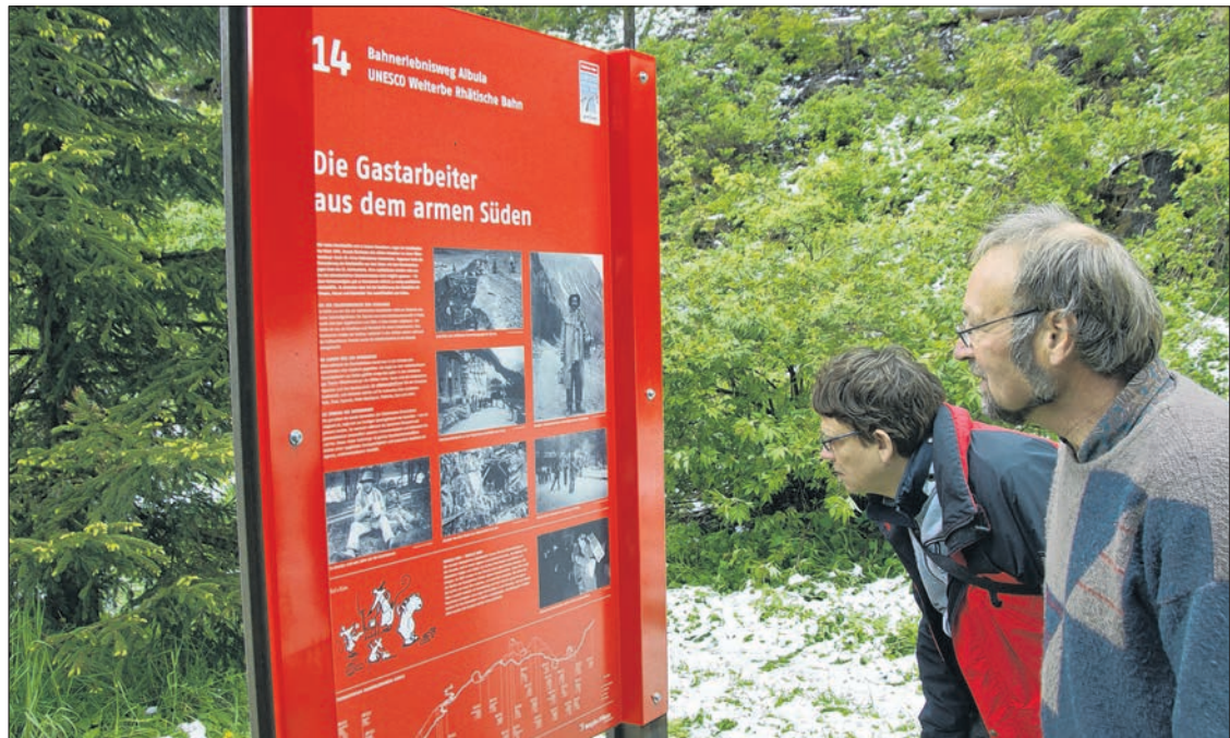
Es lohnt sich genau hinzusehen: Auf 26 Thementafeln gibts entlang dem «Bahnerlebnisweg Albula» viel zu erfahren.