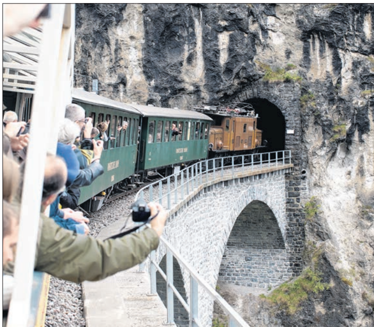
Die Fahrt mit dem Nostalgiezug übers Landwasserviadukt ist auch für Bahnfreunde ein Ereignis.