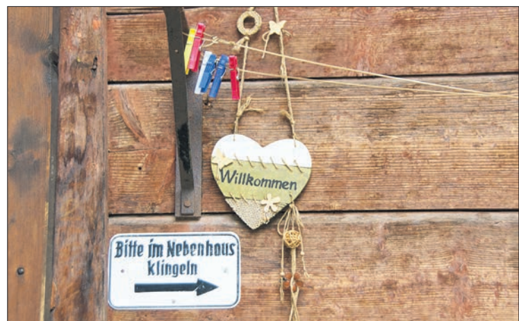
Wenn auch der Zug nicht mehr hält: Willkommen ist man beim Bahnhof Stuls trotzdem ...