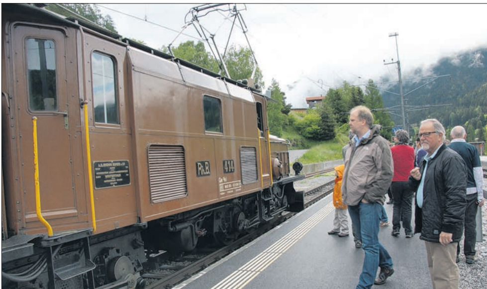
Beim kurzen Zwischenhalt in Tiefencastel zücken die Bahnfreunde die Fotoapparate, um sich vor der historischen Krokodil-Lokomotive ablichten zu lassen.

Für rund 220 Aktionäre, Gönner und Sponsoren der Bahnmuseum Albula AG begann der vergangene Samstag früh und kalt, aber voller Vorfreude auf einen ereignisreichen «Tag der Bahnfreunde»: Bereits kurz nach neun Uhr stiegen sie in Chur in den bereitstehenden Extrazug, der sie mit Station in Filisur und Stuls zur ersten Generalversammlung der Bahnmuseum Albula AG nach Bergün chauffierte. Die Gäste befuhren die Unesco-Welterbe-Strecke der Rhätischen Bahn in historischen Wagen oder sogar in einem offenen Aussichtswagen. An den Stationen bewunderten fast alle die Krokodil-Lokomotive, die sich scheinbar ohne grosse Anstrengung das Tal hinauf arbeitete. Apropos Erlebniszug: Roman Cathomas, Produktmanager der Rhätischen Bahn für das Unesco Welterbe, informierte: ab sofort fährt jeden Sonntag bis zum 1. September ein solcher Sonderzug von Chur nach St. Moritz und wieder zurück.