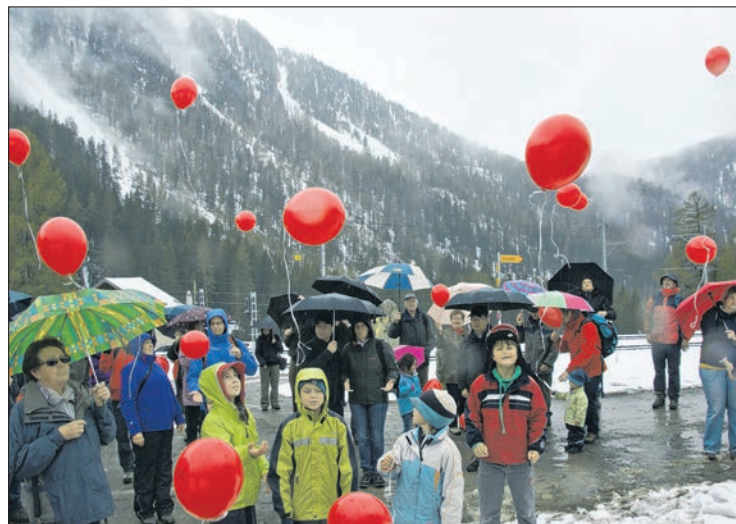
«Türli und Flidari auf dem Bahnerlebnisweg Albula», das neue Bilderbuch von Jürg Loser und Patrick Steiner schildert zwei Lausbuben, welche Bahn und Landschaft im Albulatal entdecken. In Preda (r.) flogen rote Luftballone zur offiziellen Eröffnung des Bahnerlebnisweges in den Himmel.

termann und Usé Meyer, die innerhalb zweier Jahre ein 132-seitiges Begleitbuch zum Bahnerlebnisweg Albula verfassten. Während die Aktionäre sich dann zur Generalversammlung im Bahnmuseum Albula aufmachten, fuhren rund 70 Personen mit dem Zug nach Preda, wo weitere Überraschungen warteten.